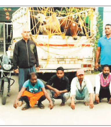
पुलिस गिरफ्त में मवेशी तस्करी।