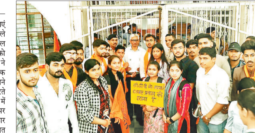
सीयू का घेराव करते अभावित के पदाधिकारी व विद्यार्थियों के छात्र-छात्राएं।