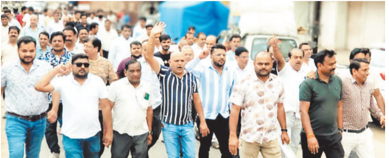
सड़क पर रैली निकालकर प्रदर्शन करते विभिन्न समाज के पदाधिकारी व अन्य।