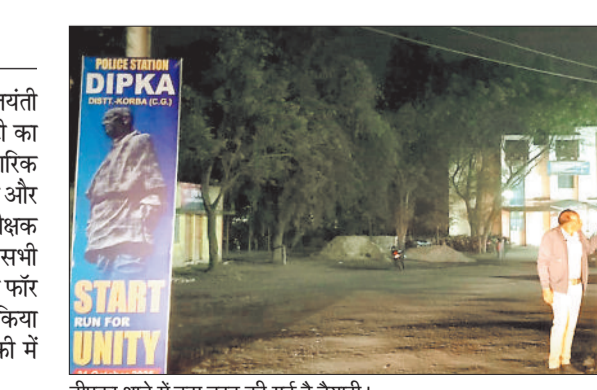
दीपका थाने में इस तरह की गई है तैयारी।

सरदार वल्लभभाई पटेल की 150वीं जयंती के अवसर पर जिले में रन फॉर यूनिटी का आयोजन किया गया है। जिसमें नागरिक भाग लेंगे और देश की अखंडता, सुरक्षा और एकता का संकल्प लेंगे। पुलिस अधीक्षक सिद्धार्थ तिवारी के निर्देश पर जिले के सभी थाना और चौकी क्षेत्र में पुलिस द्वारा रन फॉर यूनिटी एकता के लिए दौड़ आयोजित किया गया है। जिसके लिए सभी थाना चौकी में जोर-शोर से तैयारी की गई है।