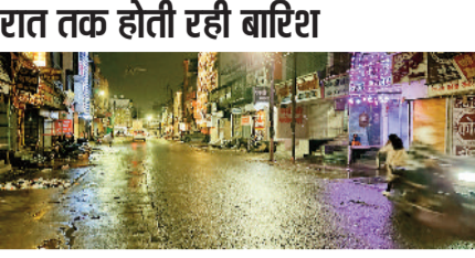
मौसम के तेवर गुरुवार को भी बदले रहे। तूफान के प्रभाव से सुबह से आसमान पर घने बादल छाए रहे, दिन में कई बार बुदबुदाई हुई, वहीं रात में बारिश शुरू हो गई। कभी हल्की तो कभी तेज बारिश होने से शहर तरबतर हो गया। मौसम विभाग के अनुसार आगामी 24 घंटे के दौरान कई स्थानों पर बारिश हो सकती है।