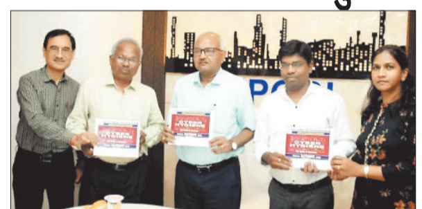
साइबर सुरक्षा की जानकारी देते अधिकारी।

खास बात विद्युत कंपनी के एमडी ने वीसी के माध्यम से साइबर सुरक्षा की दी जानकारी