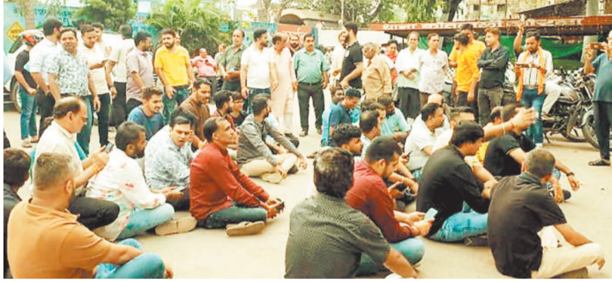
कोतवाली थाने के बाहर प्रदर्शन करते समाज के लोग।