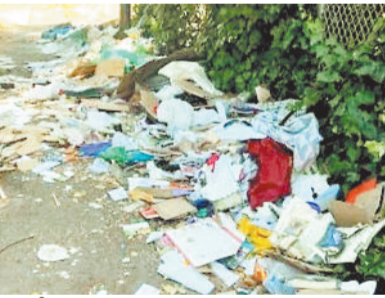
कालोनी में पसरी गंदगी।

एसईसीएल वेलफेयर बोर्ड के सदस्यों ने कुसमुंडा क्षेत्र का दौरा कर क्षेत्र में चल रहे विकास कार्यों का निरीक्षण किया। इस दौरान टीम ने अस्पताल, कॉलोनी सहित अन्य स्थलों पर पहुंचकर एसईसीएल प्रबंधन द्वारा कराए जा रहे कार्यों की भी समीक्षा की। उल्लेखनीय है कि इससे पूर्व