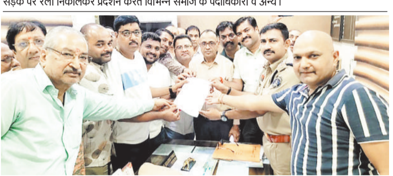
कटघोरा थाना प्रभारी को ज्ञापन सौंपते समाज के पदाधिकारी।