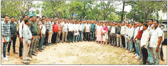
प्रशिक्षण का बहिष्कार करते प्रबंधक।